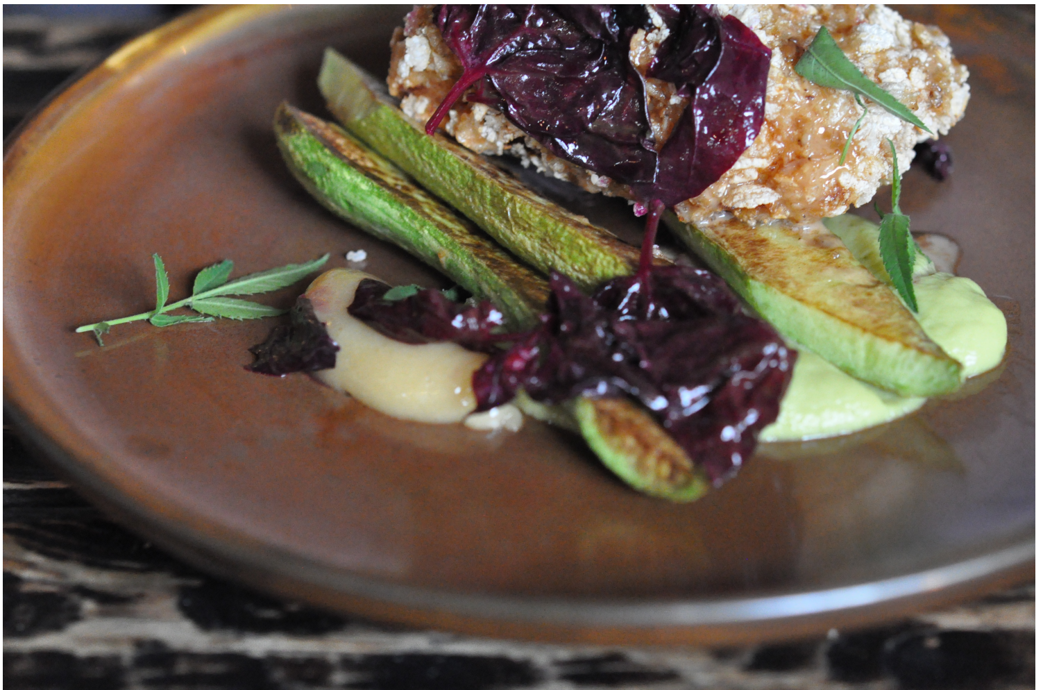
Un concerto pour asperges croquantes et ricotta fondante...