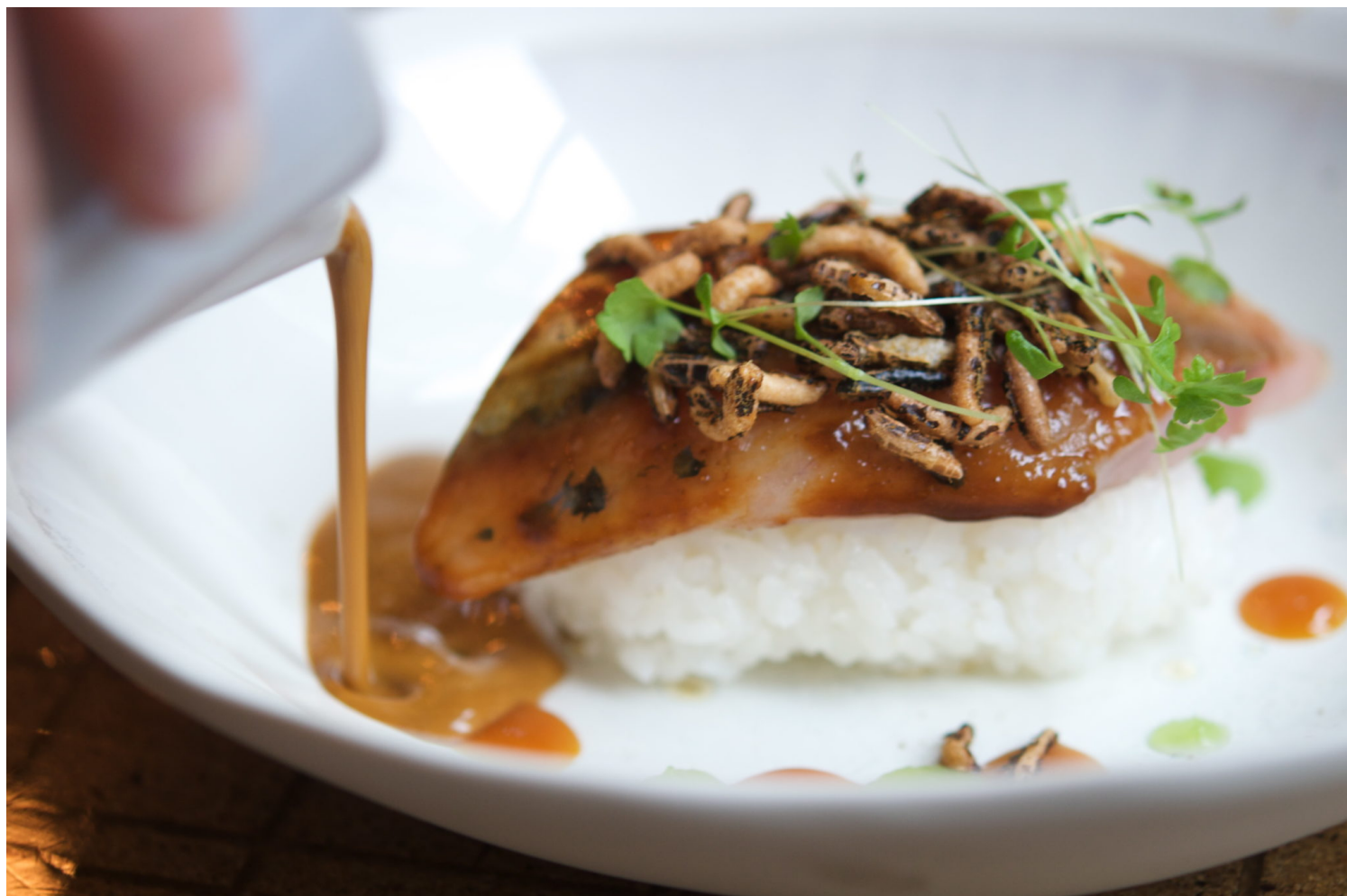
Suivi d'un aguichant flétan émoustillé de chou-fleur et saupoudré de bonite...